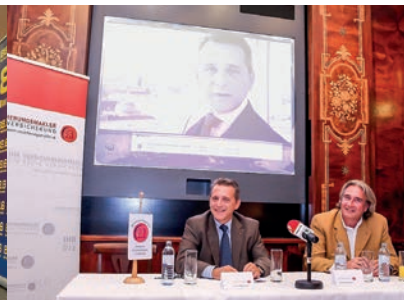
Presse & PR