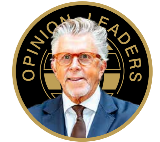
Herausgeber Gerhard Krispl