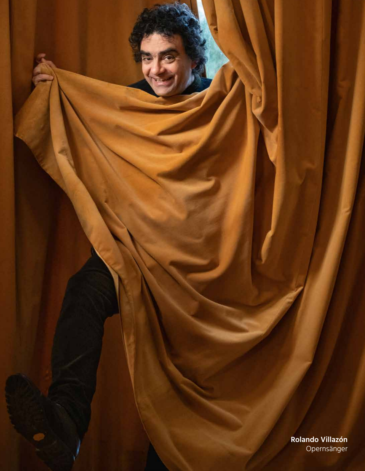
Rolando Villazón Opernsänger