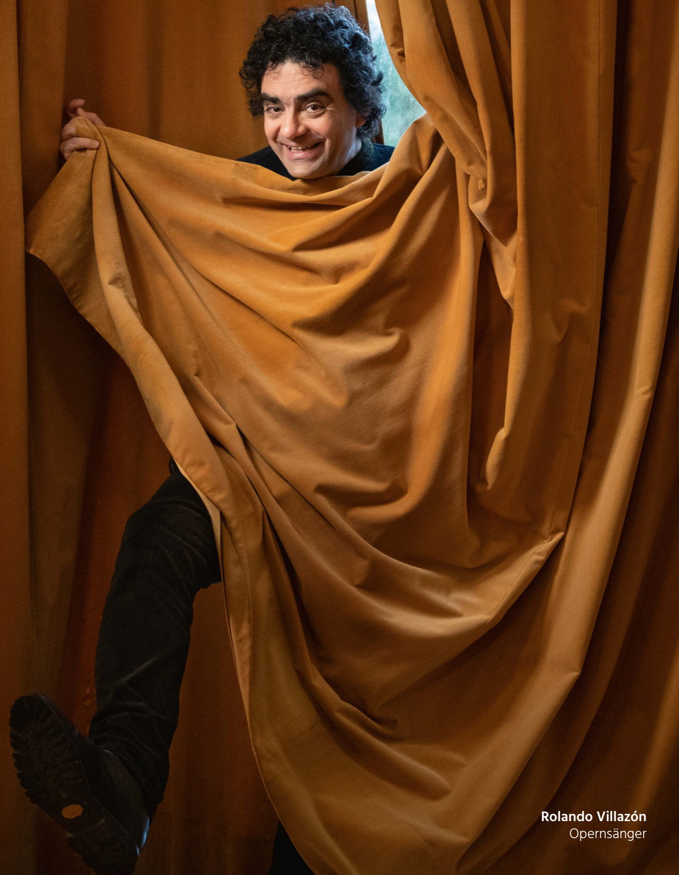
Rolando Villazón Opernsänger