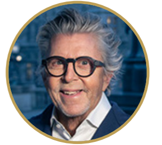
Herausgeber Gerhard Krispl