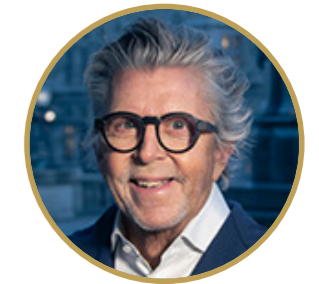
Herausgeber Gerhard Krispl